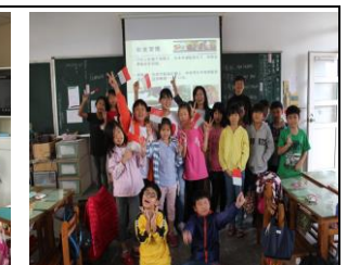
◎廣達國際大使交流活動