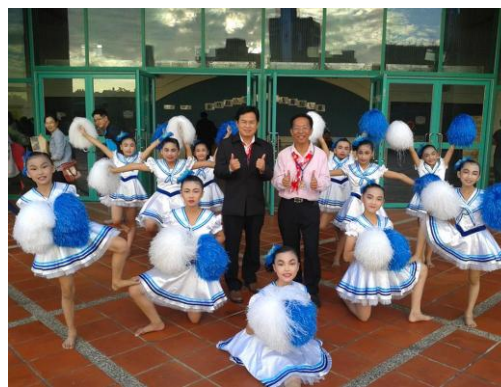
新竹縣 102 年度舞蹈比賽 雙溪國小榮獲優等第二名